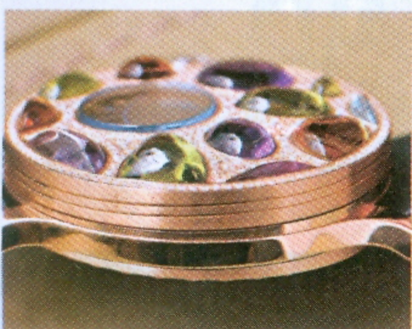
◆表身分成兩層，上層寶石蓋可隨意轉動，下層表面則是偏心設計。 ◆邊緣的寶石切割好像很隨意，其實是經過特別設計，令每枚Stria Luce表面也有不同。

此表的顏色寶石是鑲嵌在鑽石的表蓋上，就好像沙灘上長期被沖刷的圓石一樣，看時間不能心急，要扭動這個寶石蓋，直至找到指針為止。 售價$450,000