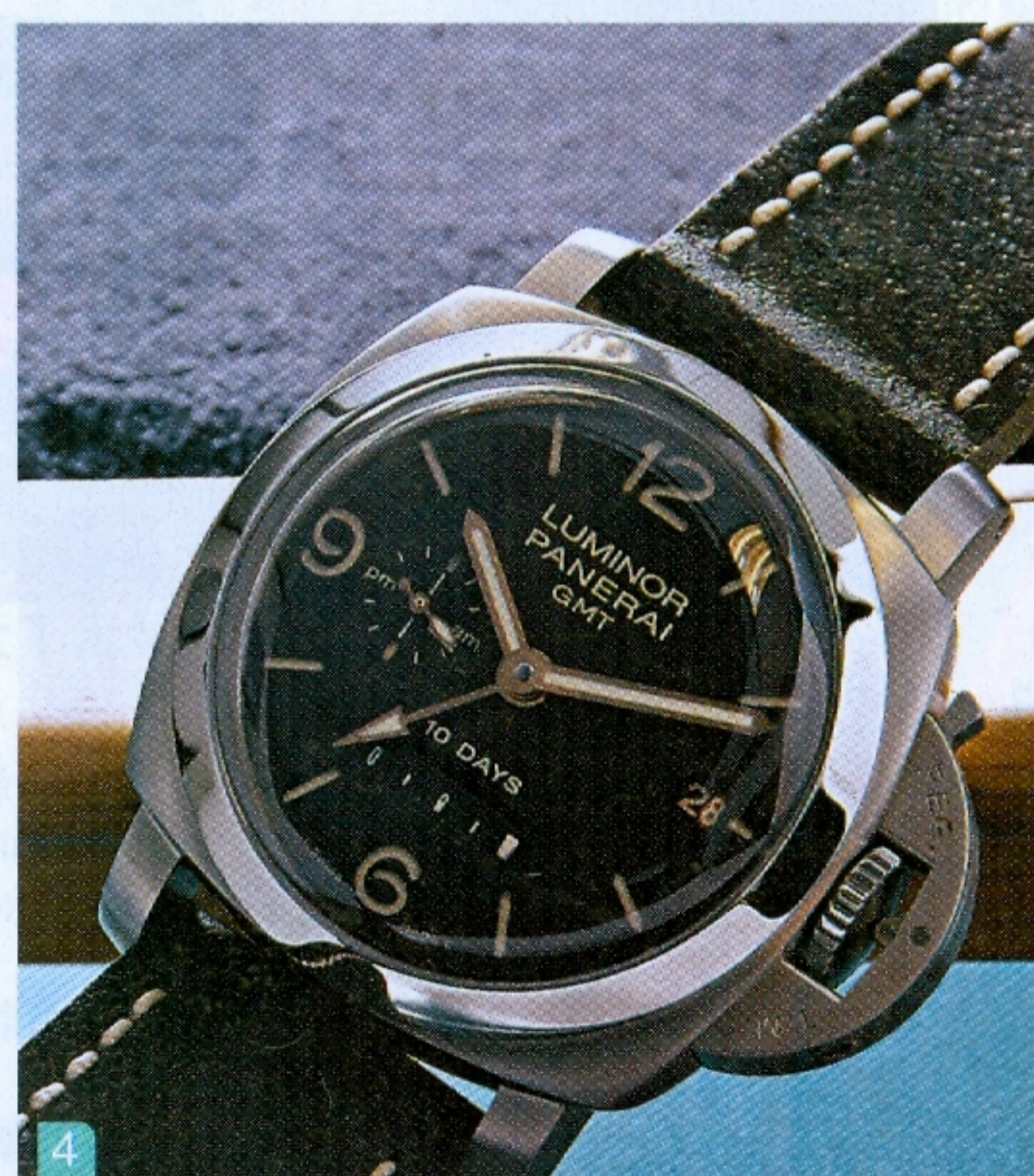
PAM354規格 機芯：Cal. P.2003、自動上鏈、十天動力儲存 物料：精鋼 防水：300米 售價：$136,800 (限量二十枚)