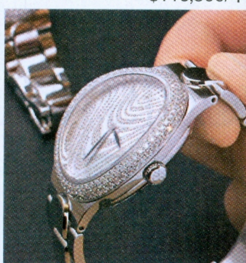
◆鑽石鑲嵌別樹一格，表身和表面也用不同鑲嵌法。 ◆一套三枚，表身以弧形為主，明顯是為女性而設。

Serena Garbo的鑽石排列很特別，圖案在太陽照射下，就好像四濺的水花。這套腕表全球限量僅兩套，分別在中東杜拜和香港，售價不太貴，但勝在手工和罕有度極高。 售價$101,500/上 $141,500/中 $116,500/下