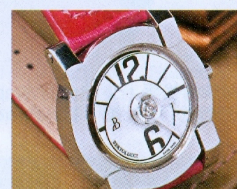
◆表面設計保持品牌獨有偏心造型。 ◆鑽石放置在轉動的時、分指針上。

這款Lentis中置鑽石的腕表，設計源自上世紀三十年代的香檳表，多用於宴會上。Bertolucci要演繹的，是表演如何用一粒鑽石營造出獨當一面的效果。 售價$12,500