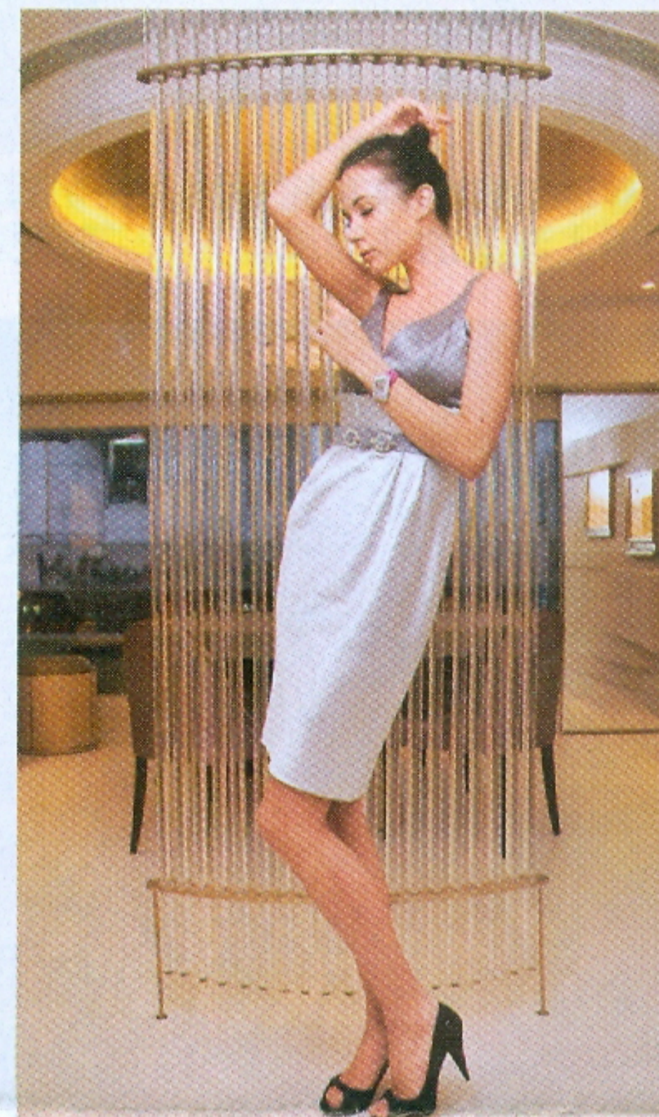
◆今次拍攝新表的地方，是品牌在中環皇后大道中萬年大廈一樓新設的首家專門店。

鑽石表也可配合Casual Chic衣着配搭，而不應只是用來應付宴會或長放在保險箱。Bertolucci早已明白這點，上次的Starry就透過地中海風情表達，今次呢？一套三款Serena Garbo，簡約鑽石配搭有Casual Chic的花巧，即使Shopping或上班佩戴，這款鑽表不會太過誇張耀眼，但渾圓表身卻有自家特別風格。外形相信是按照上世紀三十年代的Art Deco元素而設計，腕表恍如飾物一樣，可以隨身佩戴。值得留意是這款腕表全球只有兩套，一套在地球上最富有的國家之一杜拜，另一套則在大家面前。