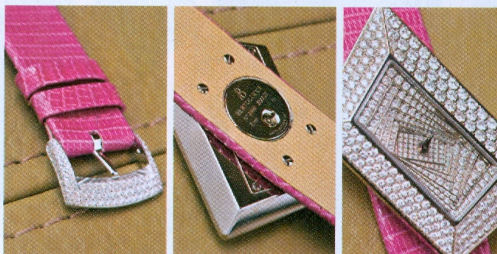
◆表帶也鑲滿鑽 ◆調校時間的按鈕被安裝在表底。 ◆每行鑽石由大至小排列。

這是一枚令人充滿驚喜的腕表，鑽石很多，表身形狀有趣，各層鑲嵌設計獨特，表身更不規則穿插於表帶之上。為了不阻礙抽象的外觀，表冠改放於表底。 售價$780,000